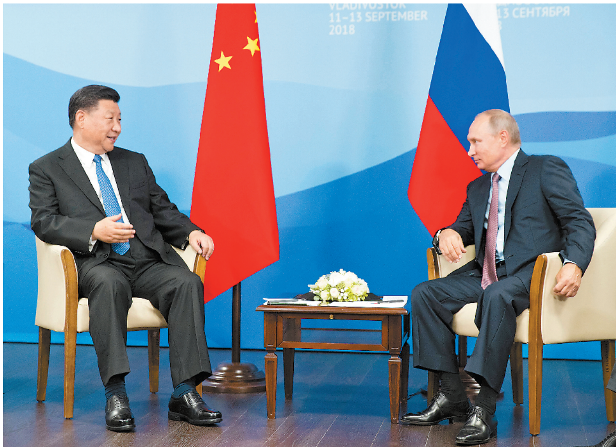
9月11日,国家主席习近平在符拉迪沃斯托克同俄罗斯总统普京举行会谈。