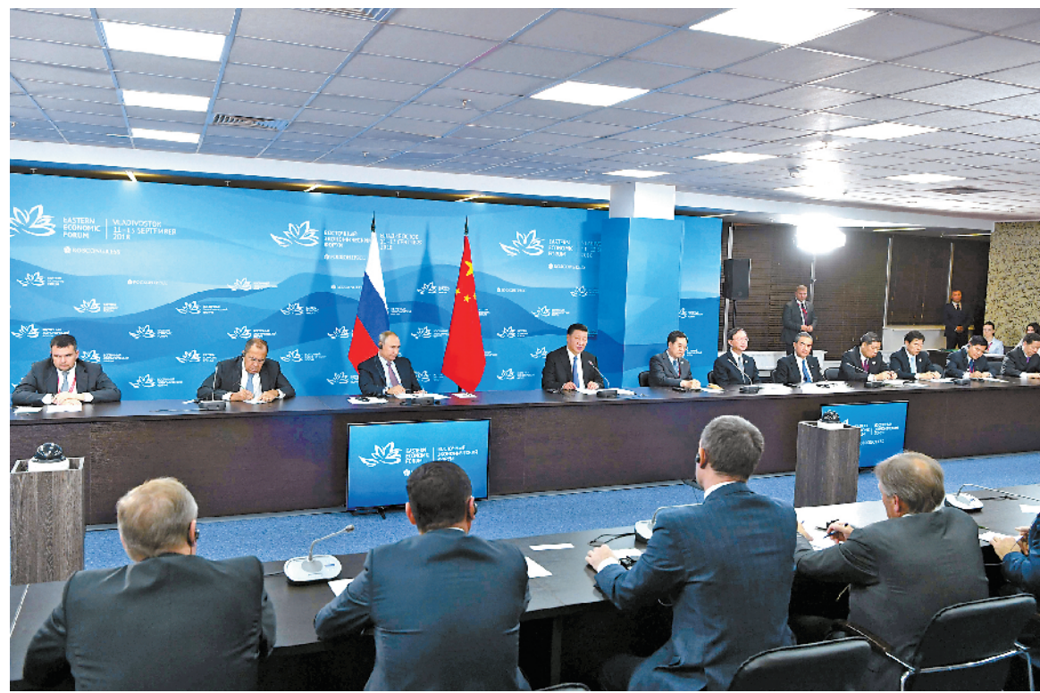
九月十一日,国家主席习近平在符拉迪沃斯托克和俄罗斯总统普京共同出席中俄地方领导人对话会。