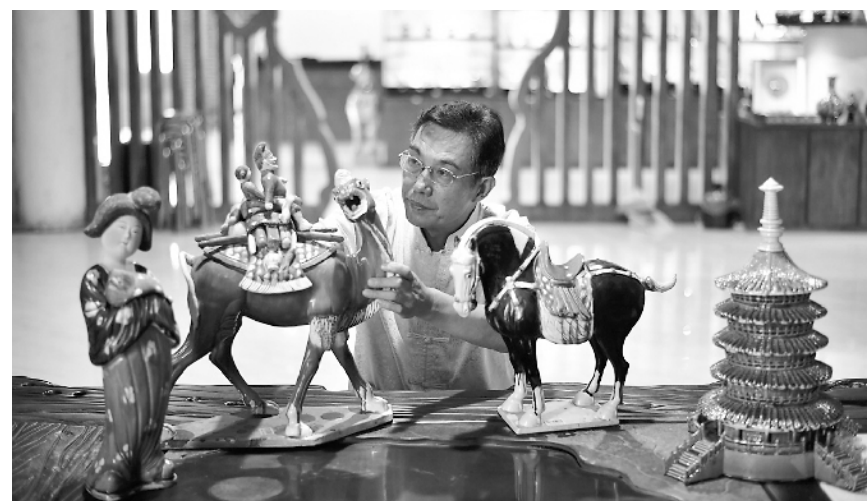
位于河南省孟津县的南石山村因生产唐三彩而闻名中外，目前全村有唐三彩生产企业 70 余家，年生产各类唐三彩工艺品近百万件，有力带动了当地经济发展。这是唐三彩烧制技艺传承人在研究作品。

钱塘江杭州段因江流一波三折，形如“之”字，又称“之江”。据媒体报道，之江两岸将崛起之江文化产业带，近期重点实施 32 个重大文化产业项目，总投资 1000 亿元。