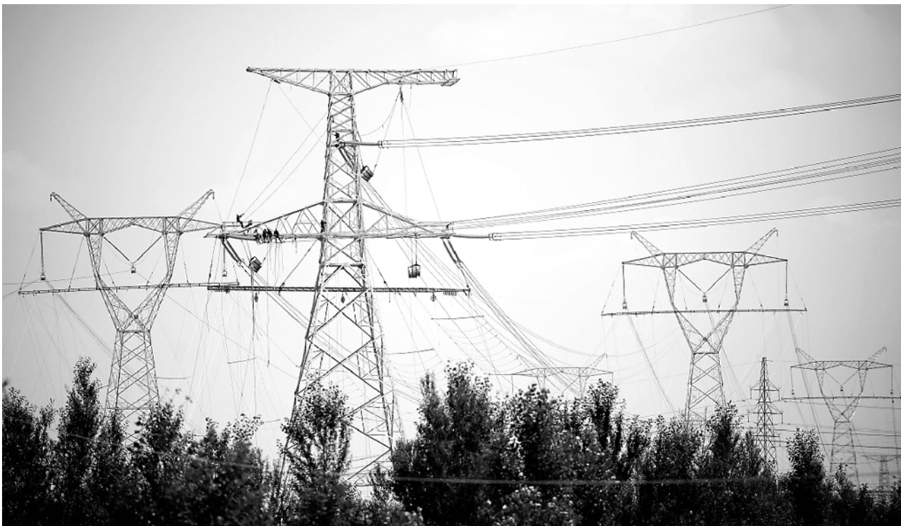
近日，陕北风电基地 750 千伏集中送出工程开始架线施工作业。