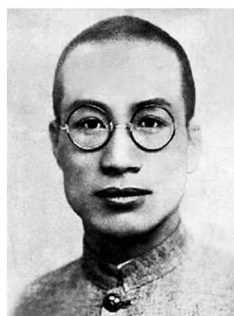
赵博生像(资料照片)。

河北省黄骅市慈庄村一座院落,简朴中透着庄重,这就是宁都起义主要领导人赵博生烈士故居。2014年经重新修缮后,与赵博生烈士纪念馆一同被作为爱国主义教育基地对外开放。故居内陈列着赵博生烈士的部分遗物和生平事迹展览,一幅赵博生烈士戎装照被放置在堂屋北墙的正中央,透过照片上烈士坚毅的眼神,一段烽火硝烟的革命历史徐徐展开。