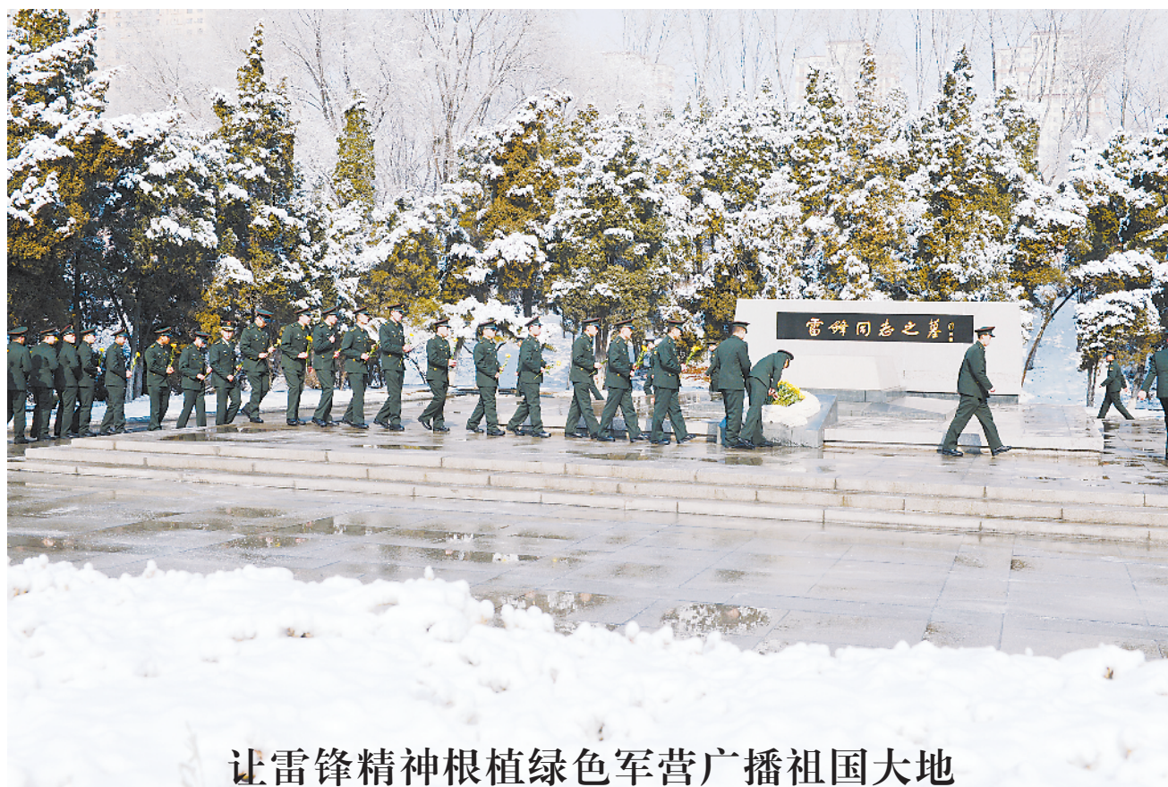
让雷锋精神根植绿色军营 广播祖国大地