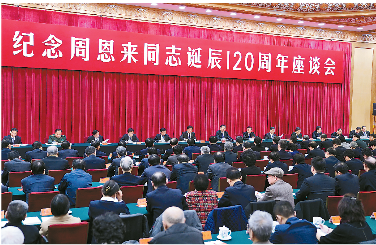
3月1日,中共中央在北京人民大会堂举行纪念周恩来同志诞辰120周年座谈会。中共中央总书记、国家主席、中央军委主席习近平发表重要讲话,中共中央政治局常委李克强、栗战书、汪洋、王沪宁、赵乐际、韩正出席座谈会。

新华社北京3月1日电 (记者吴晶、黄小希)中共中央1日上午在人民大会堂举行座谈会,纪念周恩来同志诞辰120周年。中共中央总书记、国家主席、中央军委主席习近平发表重要讲话强调,新时代中国特色社会主义的航标已经明确,中华民族伟大复兴的巨轮正在乘风破浪前行。周恩来同志青年时代曾经写下这样的寄语:“愿相会于中华腾飞世界时。”今天,我们可以告慰周恩来同志等老一辈革命家的是:近代以来久经磨难的中华民族迎来了从站起来、富起来到强起来的伟大飞跃。周恩来同志生前念兹在兹的中国现代化的宏伟目标,一定能够在不久的将来完全实现。