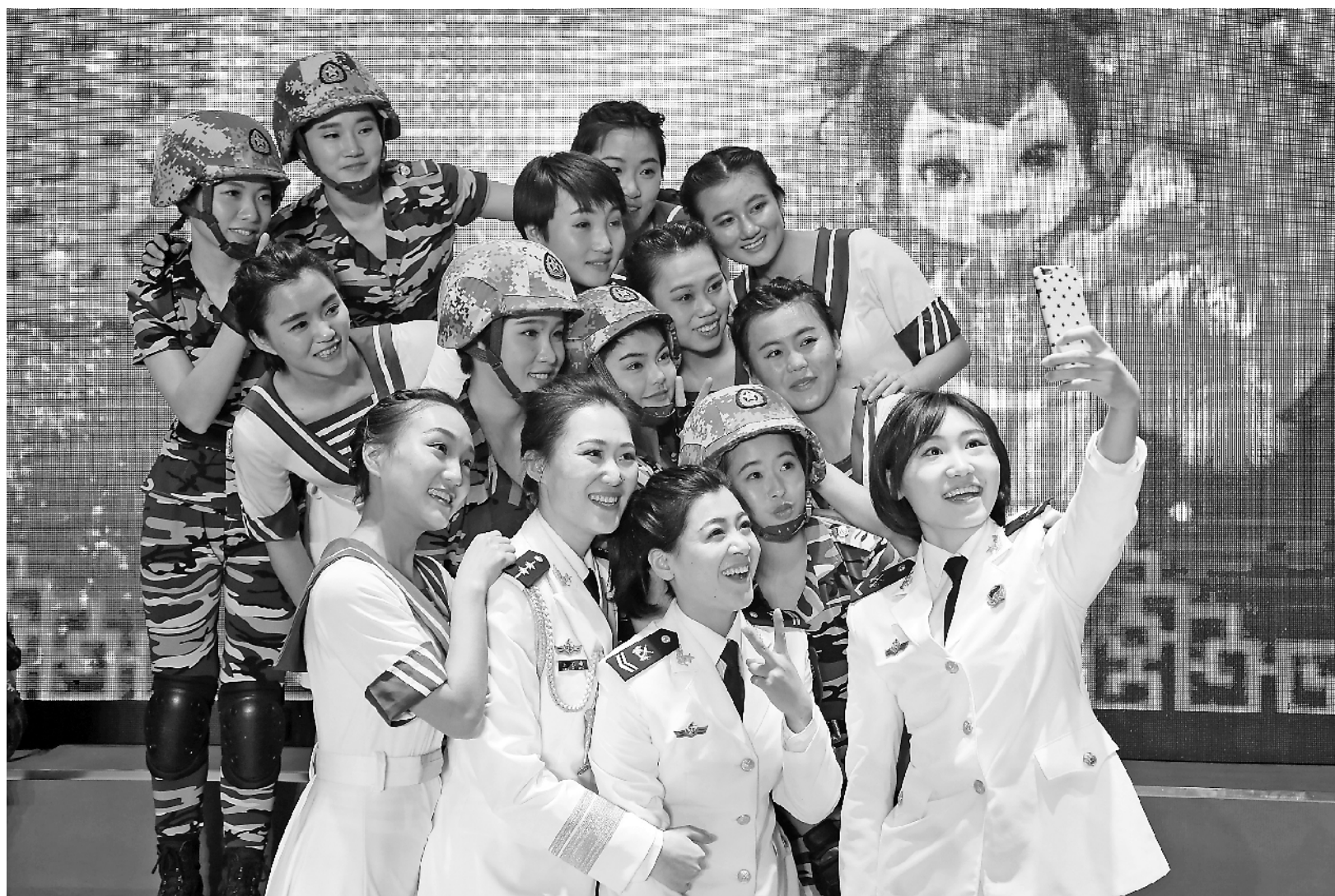
1月30日，北海舰队某旅举行迎新春文艺演出。演出完美落幕后，该旅一营四连的女兵们沉浸在节日的喜悦中，身着演出服，来了一张开心自拍。

“春节快乐”——这是节日里最畅销的祝福，而这一祝福在军人口中却是一言九鼎，因为他们把你们的节日与快乐，义无反顾地作为自己的使命与职责，担当在坚实的肩头！