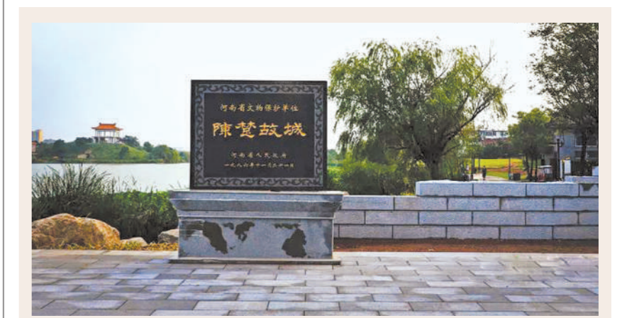
陈楚故城是河南省历史文化名城，位于河南省周口市淮阳区。此城是西周初年，陈国国君陈胡公始筑，为陈国都城。楚灭陈后，于公元前278年迁都于此，因这里曾经是陈楚两国故都，故称“陈楚故城”。

以逸待劳为“三十六计”中第四计，属于“胜战计”部分，其军事实践多见于古代战争。桂陵之战中，齐军以逸待劳，大败回援的魏军；夷陵之战中，东吴主将陆逊面对刘备军队的挑战，坚守不出，以逸待劳，最终火烧连营，取得大胜。