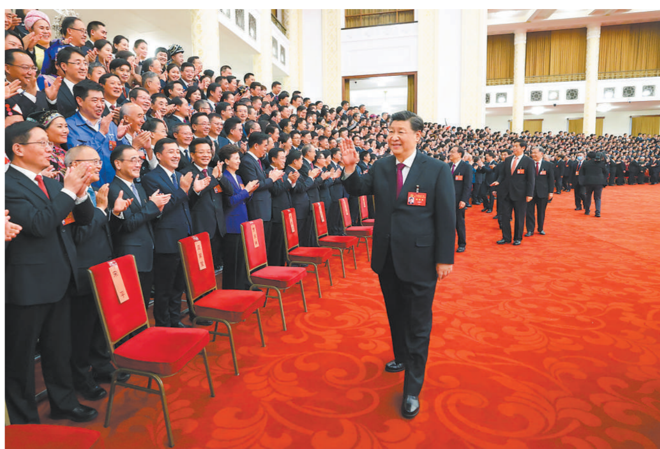
10月23日下午,中共中央总书记、国家主席、中央军委主席习近平等领导同志在北京人民大会堂亲切会见出席党的二十大代表、特邀代表和列席人员,并同大家合影留念。