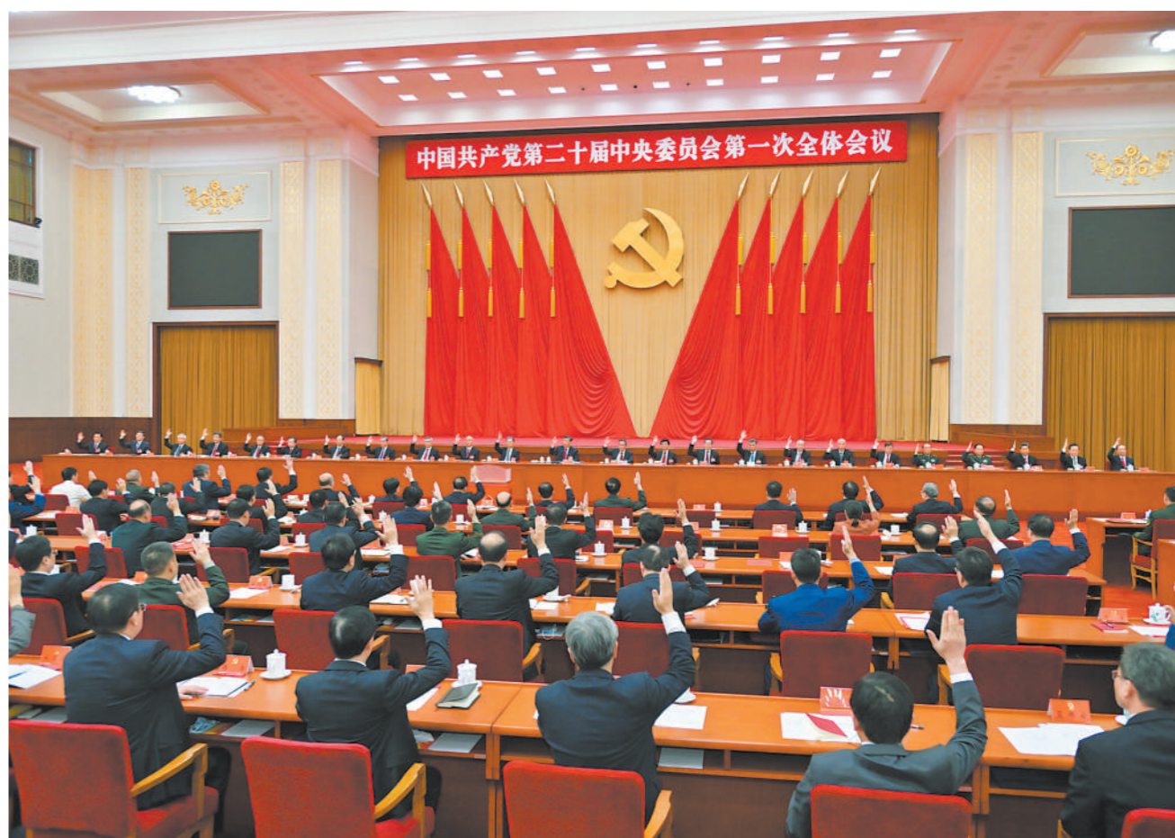
左图:10月23日,中国共产党第二十届中央委员会第一次全体会议在北京人民大会堂举行。习近平同志主持会议并在当选中共中央委员会总书记后作重要讲话。