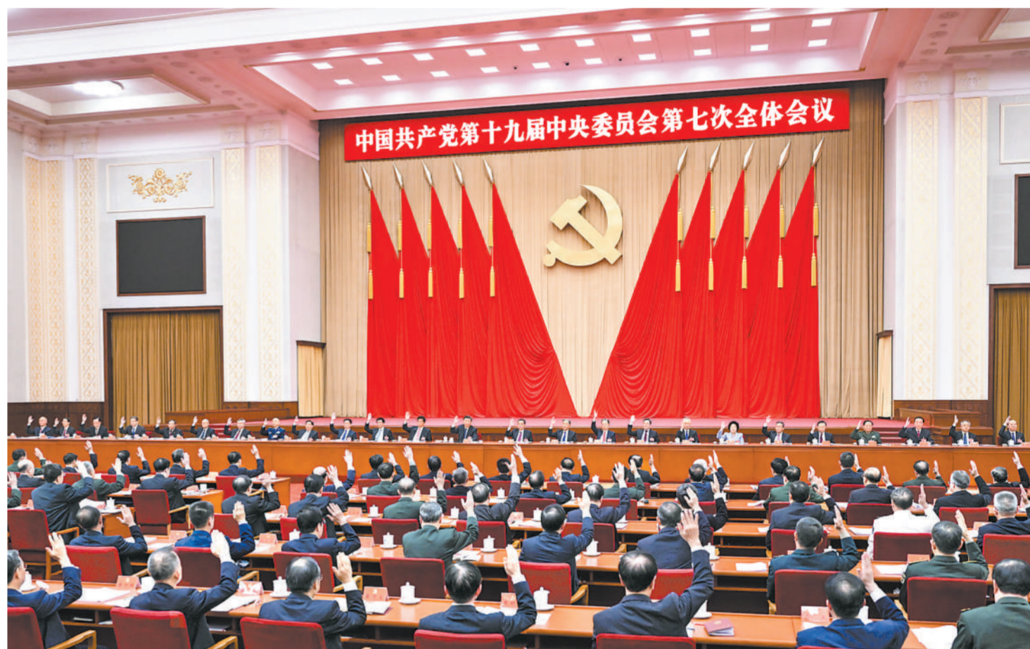
中国共产党第十九届中央委员会第七次全体会议,于2022年10月9日至12日在北京举行。中央政治局主持会议。