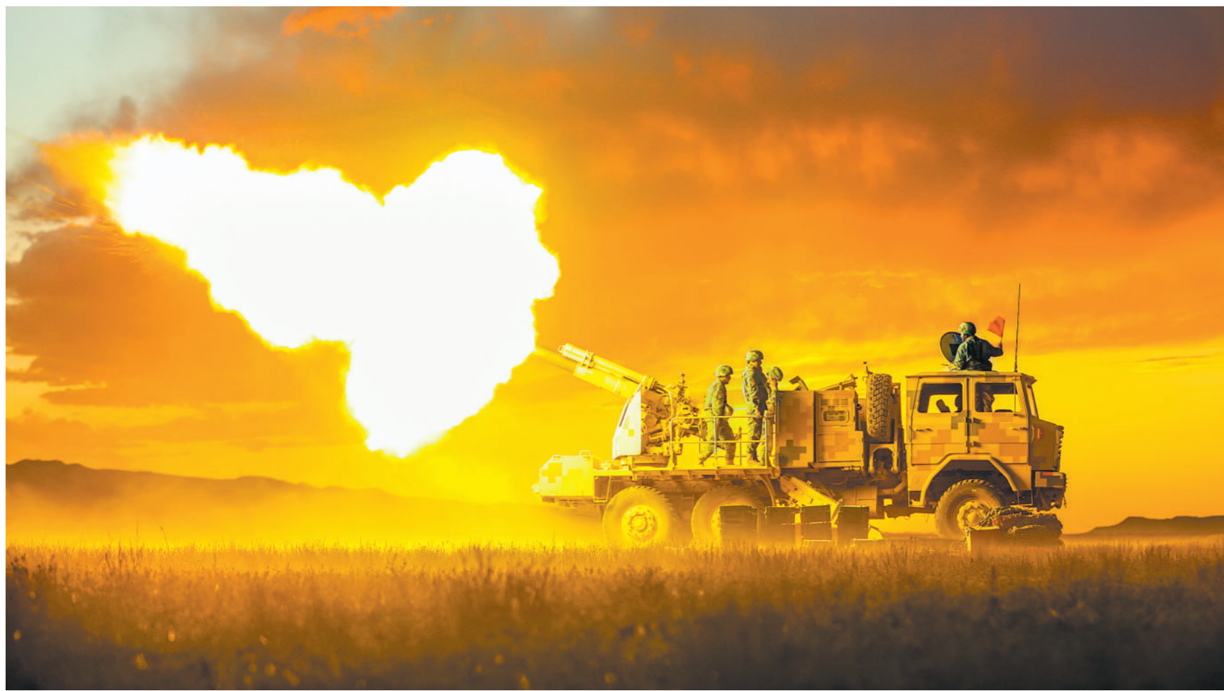
连日来,陆军某合成团组织火力分队进行实弹射击考核,全面检验精准打击能力。