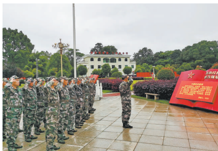
7月上旬，湖南省宜章县人武部组织新入伍民兵进行宣誓活动。

上门服务暖人心，一系列务实举措让军人军属荣誉感、获得感得到有效提升，也激发了当地青年积极参军报国热情。今年上半年，该市适龄青年上站体检率比去年增长5个百分点。