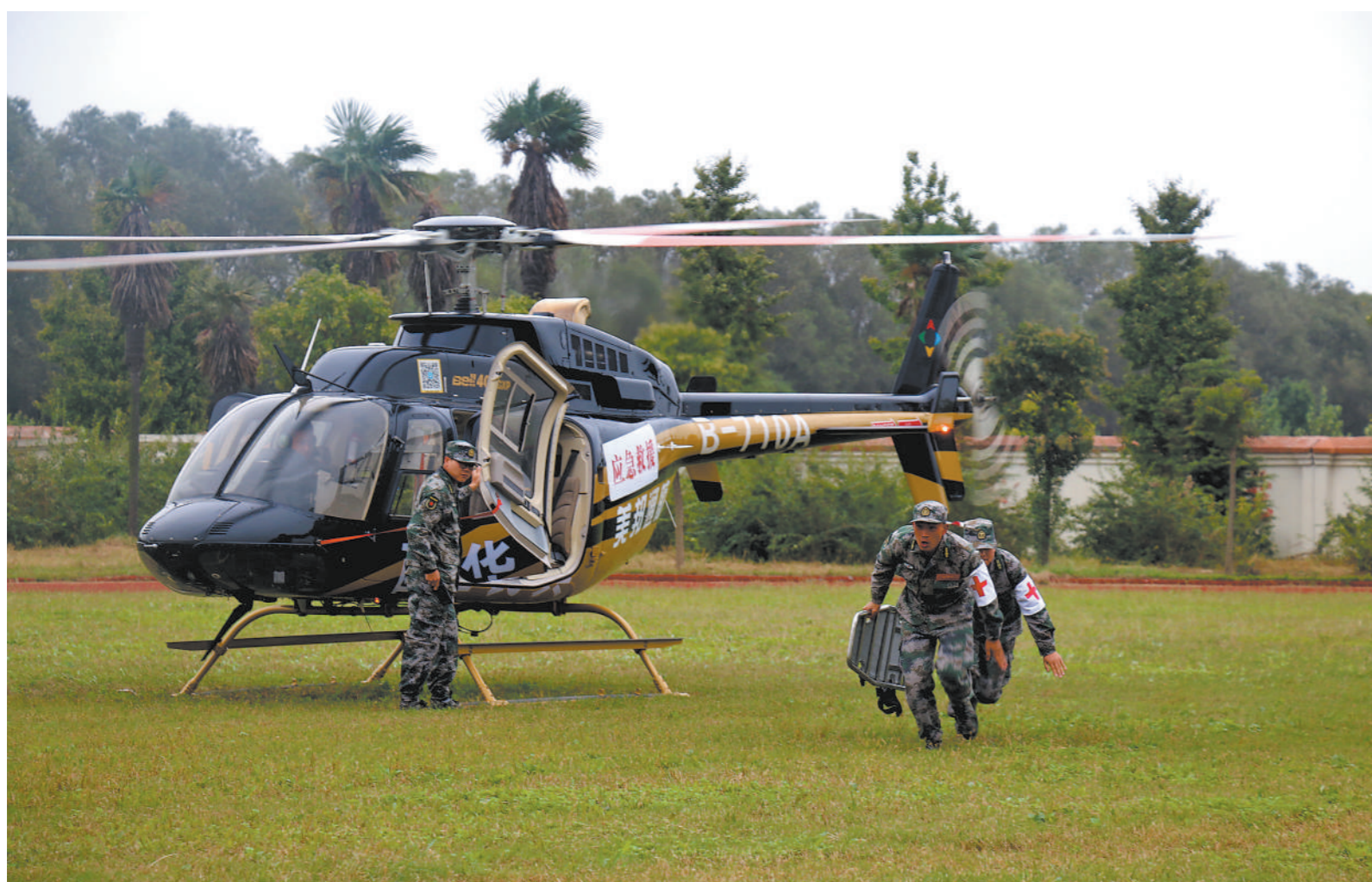
七月初，河南省西华县人武部组织民兵医疗救护保障分队开展专业技能训练，着力提高应急保障能力。图为民兵演练抢救“伤员”。

的行动阐释世人一个道理：党员干部手中的权力、所处的岗位，是党和人民赋予的，是为党和人民做事用的。党员干部惟有始终与党和人民事业为重，朝朝心系于民、事事行之为民，追求大我，摒弃小我，才能当好人民群众的知心人、贴心人、领路人。政德只在民心里，名声自在群众中。每名党员干部都要牢记“民心是最大的政治”，主动拆除“心墙”，架起“心桥”，细听基层声音、常问百姓之苦、勇解百姓之忧，为心怀“国之大者”写下生动注脚。这样一来，名利杂念的困扰就会减少，声色犬马的诱惑就会自觉抵制，浩然之气就会自然养成，共产党人执政为民的价值本色也就会擦得更加鲜亮。