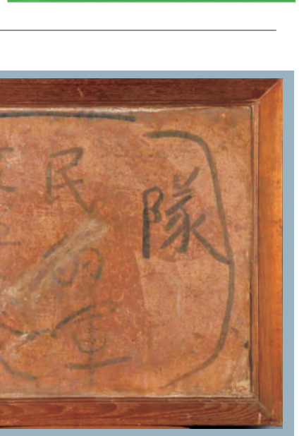
1936年,红军路过宁夏时,在固原祁家堡子草泥墙上留下的红色标语:红军是人民的军队。