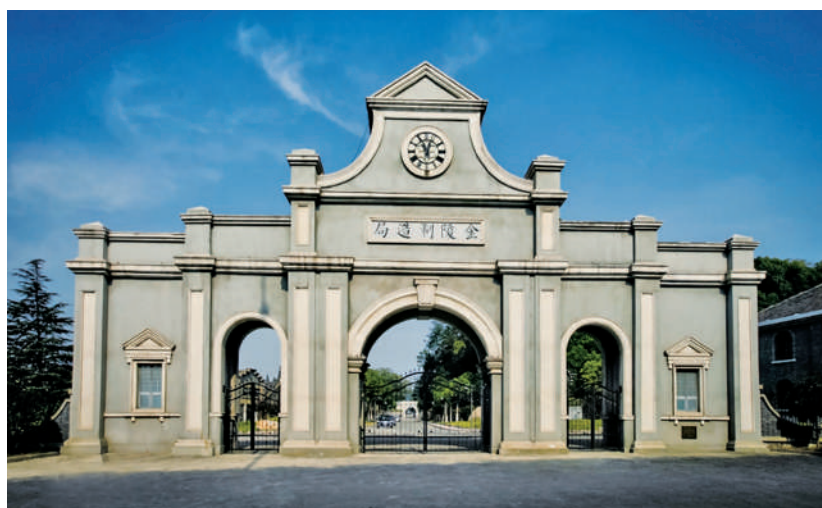
位于南京市秦淮区中华门外的金陵机器制造局,是南京第一座近代机械化工厂,也是当时中国四大兵工厂之一,素有“中国民族军事工业摇篮”之称。图为金陵机器制造局大门新貌。