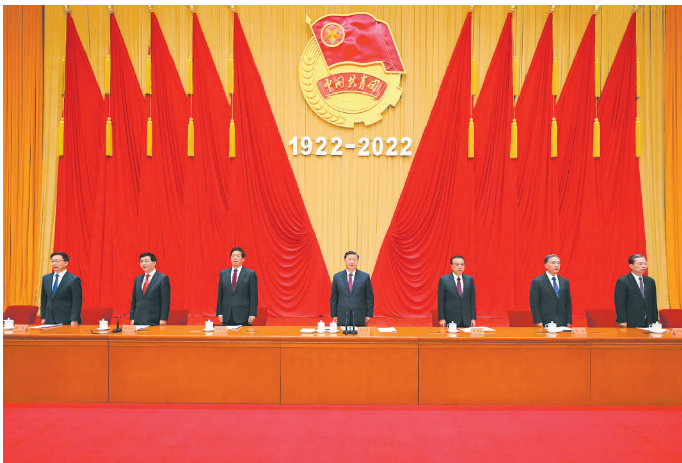
5月10日,庆祝中国共产主义青年团成立100周年大会在北京人民大会堂隆重举行。中共中央总书记、国家主席、中央军委主席习近平在大会上发表重要讲话。