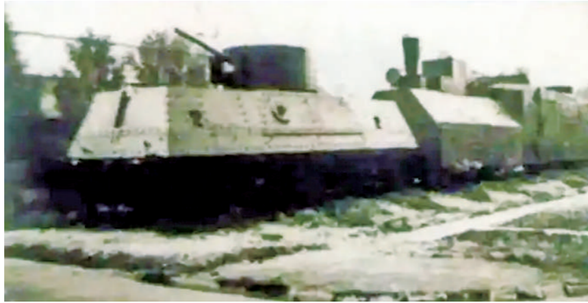
铁甲列车局部外形。

1924年,随着第一次国共合作的实现,广东成为全国革命的中心,工农运动蓬勃发展。军阀、商团的骚扰,让广东革命政权内部危机严重。中共广东区委征得孙中山同意,组建大元帅府铁甲车队。11月中旬,经过改组扩充的大元帅府铁甲车队正式成立,这是第一支由中国共产党直接建设和掌握的武装力量,也是之后被称为“铁军”叶挺独立团的前身。