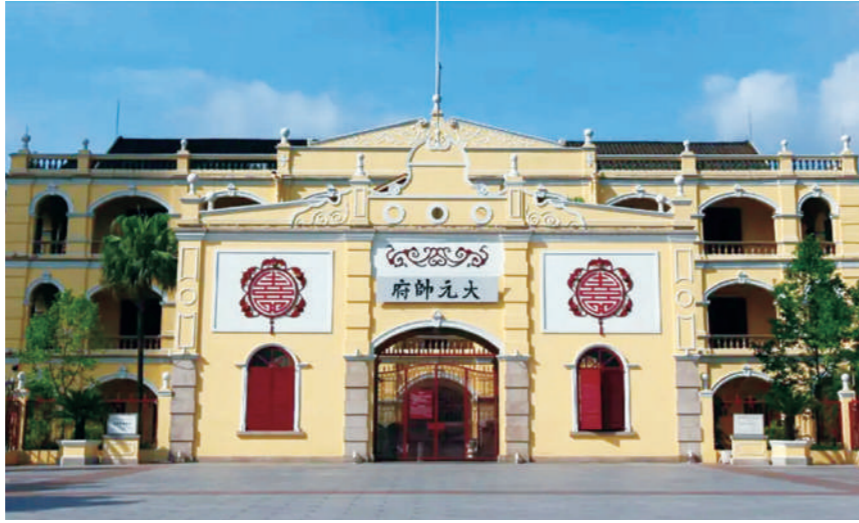
位于广东省广州市海珠区的大元帅府旧址。