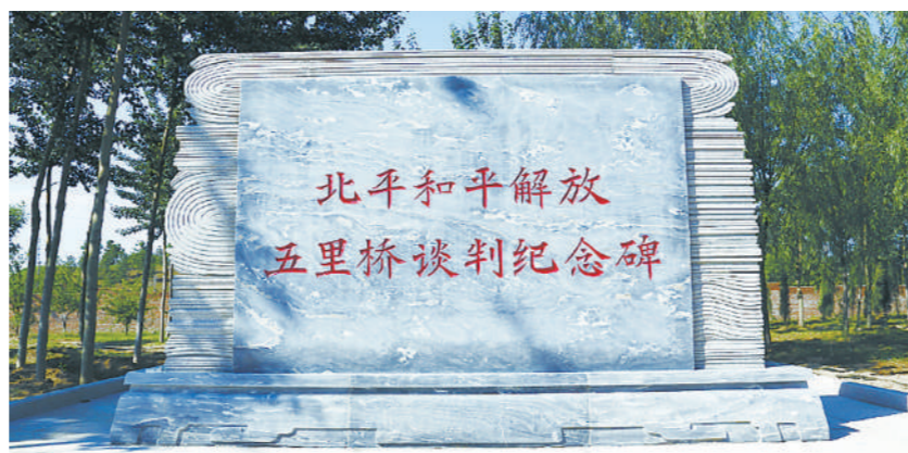
北平和平解放五里桥谈判纪念碑。

经没有了讨价还价的筹码。于是，他派出和谈代表来到位于北平东部的五里桥村，与解放军代表进行第三次谈判，地点就选在村里的张家大院。张家大院由几个四合院组成，每个院子都有走廊、石头台阶，房子是双层方挑檐，青砖灰瓦。之所以选择这里，一是这里的条件和规格在当时来说比较好，能够展现出和谈的诚意；二是出于保密考虑，这里比较隐蔽，不容易被外界发现；三是张家大院距离北平城和位于通县的平津战役前线指挥部都较近，便于双方人员往来。