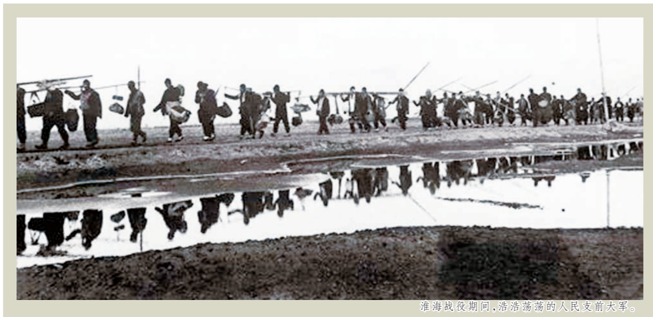
淮海战役期间，浩浩荡荡的人民支前大军。

劳务减征，出兵与生产互不影响。 淮海战役期间，劳务出兵是人民支前的重要形式。各级党政机关坚持出兵与生产并重，区分不同情形，采取出兵与生产劳务相抵、特别工种人员劳务减免等方法，既保证充足的力量支援前线，又保证足够的劳力不误生产。淮海战役总前委教育部队特别是后勤部门不要对支前工作要求过高，尽力帮助劳务出工计算、计酬方法的合理性、公平性。这些紧贴实际、实事求是的动员措施，减轻了人民群众的出兵负担，人民群众不会因为支援前线，导致生产生活受到影响，受到普遍欢迎和积极拥护。