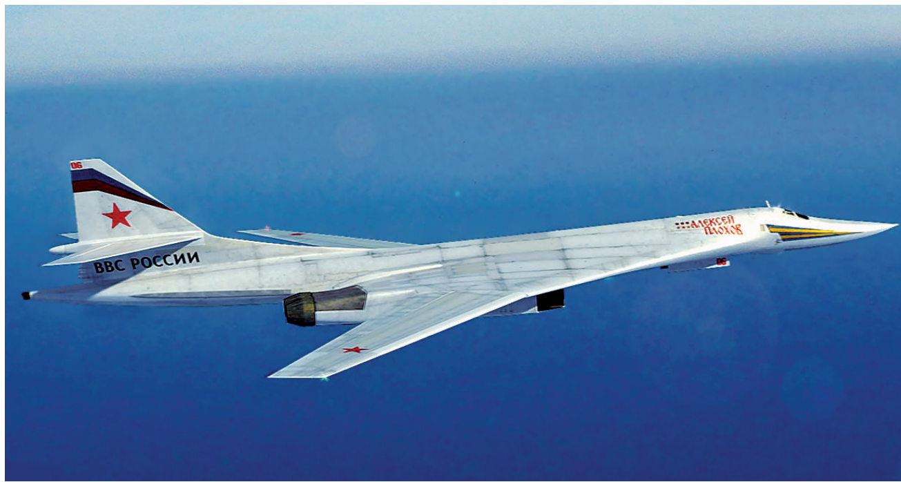
俄罗斯空军图-160战略轰炸机海上巡航。

在军队建设领域，俄罗斯国防部长绍伊古1月20日表示，在过去一年，俄罗斯武装力量新型和现代化军事装备的份额超过71%。特别是陆军和海军装备现代武器的比例提高到71.2%，战略核力量的装备比例提高到89.1%。军事装备完好率保持在95%的水平，新装备得到广泛运用，并在各种战备检查、演习、训练和军事比赛中验证了装备的良好状态。同一天，俄国防部公布俄海军未来2个月的演习计划，其中包括中俄伊三国海军将在西太平洋联演。俄国防部表