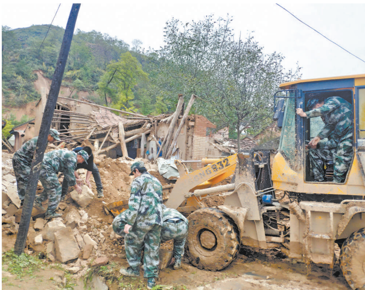
受近期持续强降雨影响，甘肃省正宁县多处出现山体滑坡、房屋坍塌、道路中断等险情。该县人武部迅速组织民兵工程抢险连、交通巡线连等投入救援工作。图为民兵正在清理倒塌房屋。

本报讯 王海山报道： 连日来，广东省中山市火炬区人武部先后组织辖区5所中学、1所职业技术学院开展学生军训。他们以队列基础动作、国防教育知识讲座为主要内容，培养青少年学生的家国情怀，不断增强他们的爱国主义、集体主义和革命英雄主义观念。