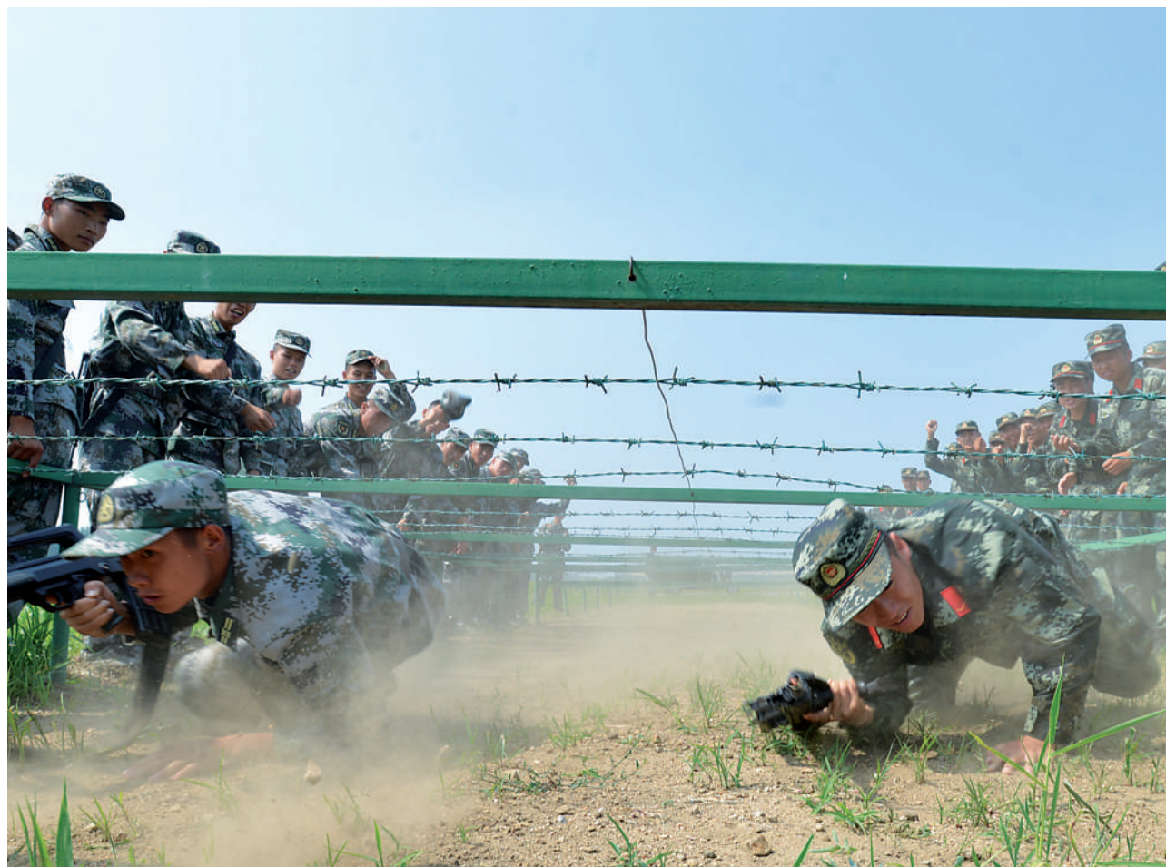
近日，辽宁省新民市人武部组织民兵应急连开展为期10天的封闭式军事训练。他们邀请武警辽宁总队二支队官兵担任军事教员，对民兵进行传帮带，切实提升民兵应急应战能力。