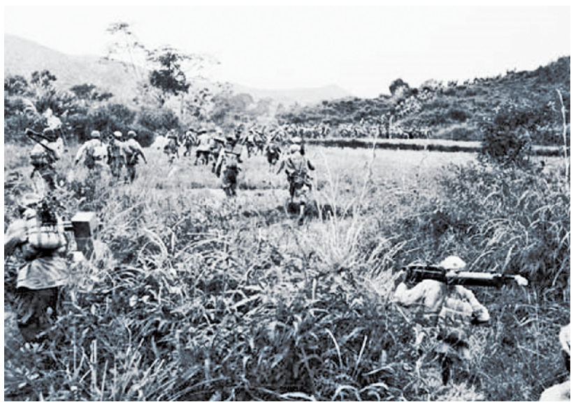
向威远堡奔袭的东北民主联军第3纵队官兵

3纵官兵在诉苦复仇立功的激励下,冒雨昼夜强行军120余公里,于30日拂晓前按计划进至威远堡以东40公里区域。不过,因8师在进至西丰县以南5公里的钓鱼台时被敌察觉,西丰之敌出现逃跑迹象。为防敌逃跑而贻误战机,3纵按照上级命令,各师立即出发向预定目标奔袭。10月1日晨,3纵部队突然出现在敌阵地前,敌部队尚在出早操,只得仓促应战。正因对战机变化的精准把握,3纵才能把固守之敌变成运动之敌,把难打之敌变成好打之敌,最终仅用4天时间便完成全歼敌116师的作战任务。