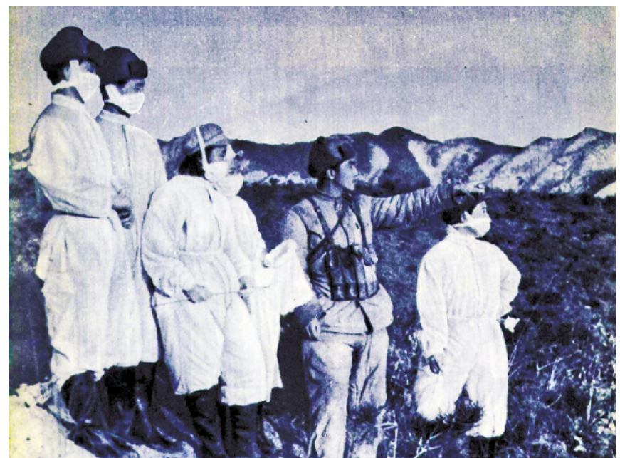
疫区内的我志愿军防疫部队人员

在防疫疫情之初,由于对细菌武器致病机理把握不准,部分单位和同志存在轻敌麻痹思想。在发现敌布撒的细菌昆虫后,个别分队指挥员思想麻痹,发现疫情不及时处理,也不上报,导致发生死亡事件。为此,志愿军开展以反麻痹为主题,以基层干部为重点对象的反细菌战思想教育,指出美军发动细菌战是其军事上连遭惨败后的疯狂挣扎,也指出细菌武器的隐蔽性和危害性,要求全体人员提高警惕,积极防范。