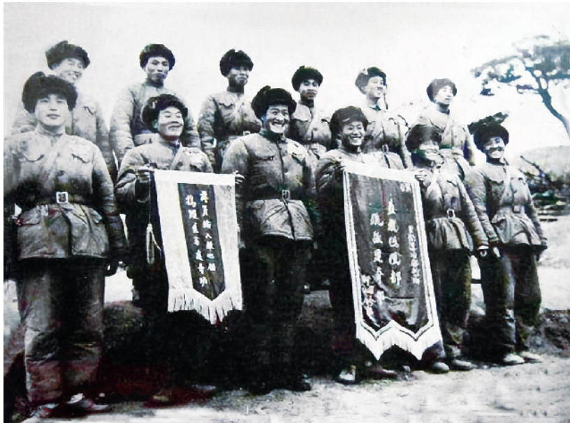
奇袭白虎团是203师侦察兵创造的经典战例,图为战斗后受奖的侦察兵