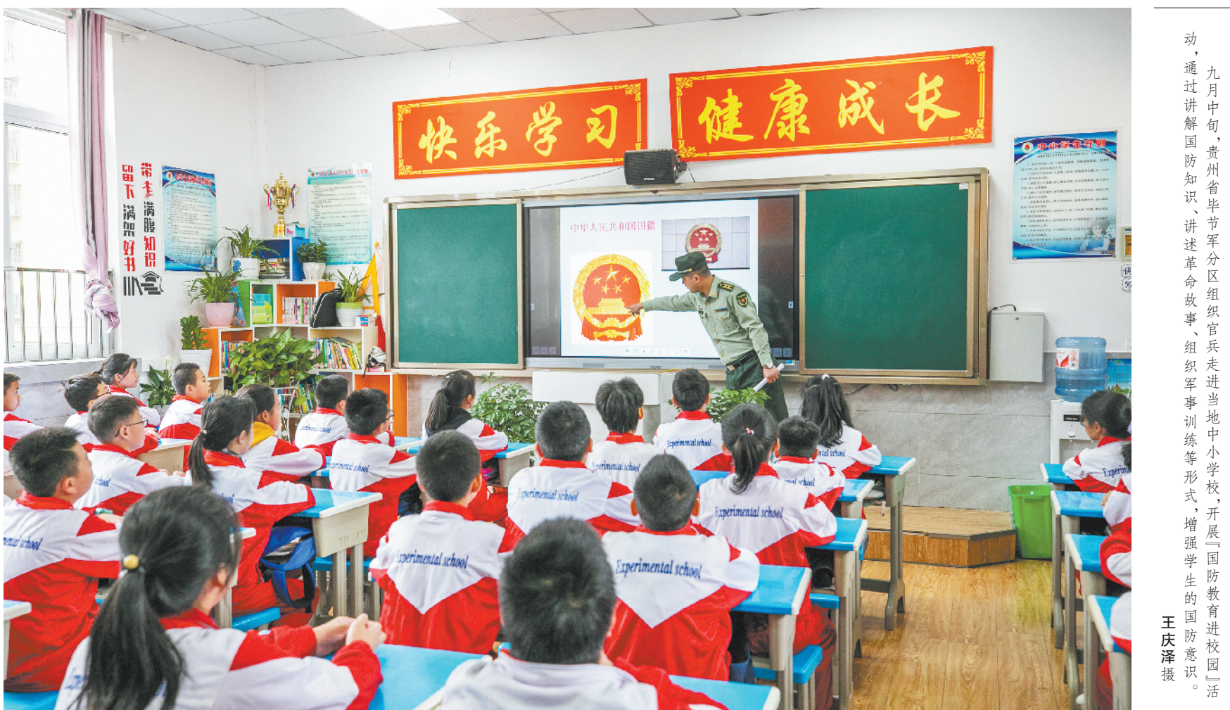
九月中旬，贵州省毕节市分区分区组织官兵走进当地中小学，开展国防教育进校园活动，通过讲解国防知识、讲述革命故事、组织军事训练等形式，增强学生的国防意识。