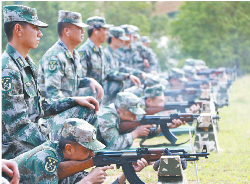
9月下旬，云南省昆明市官渡区人武部组织民兵集训，来自全区10个街道的120余名民兵完成了18个课目的训练，应急综合能力素质有了进一步提升。

在组织民兵训练的过程中，该人武部坚持“以任务为牵引、以大纲为依据、以人才为支撑、以基地为依托、以制度为保证”，通过理论辅导、实际操作、专题研讨、参观见学、经验交流等方式，重点加强民兵军事技能、业务知识等方面的学习、训练和考核。2018年，人武部按照“共同合训打基础、专业分训学操作、联合演练熟方案”的步骤，对民兵应对公共突发事件时所需的战斗效能和技能进行强化训练，有效提升民兵队伍应急响应能力。