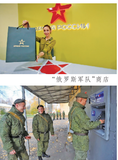
俄军官兵在自助银行办理业务