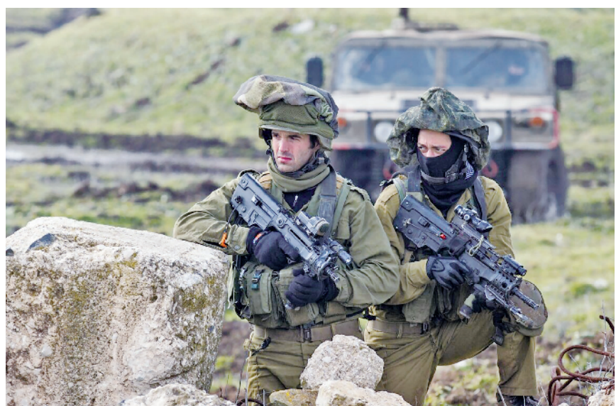
以色列国防军参加军事演习

此外,以色列还将利用人工智能与数字网络技术,将国防军各作战单位紧密联合在一起。“未来战场危机四伏,新技术将让我们充分发挥火力与机动性优势,掌握战场主动权。”