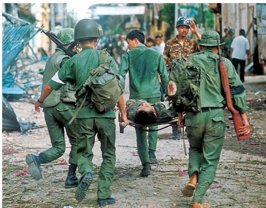
越共武装的“春节攻势”打了美军和南越伪军一个措手不及

越南民主共和国国防部长武元甲制订作战计划，决定通过大举进攻西贡（今胡志明市）、顺化等几乎全部南越城市，向美方展示抗战到底的决心，推动美国国内反战浪潮发展，打击美国战争意志，最终逼迫美国撤军。谁也不会想到，一直擅长打游击战的越共武装会大规模进攻南越城市，武元甲的计划正是利用了这一点。