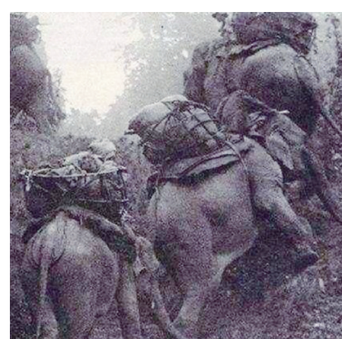
日军的“大象运输队”

在经过20余日艰难行军抵达英帕尔前线时，日军的牲畜已因缺乏饲料和美英战机轰炸而死亡殆尽，在东南亚炎热的气候条件下，牲畜肉很快腐烂变质，无法食用，口粮、弹药数量急剧下降。日军“因粮于敌”的设想破灭，防守英帕尔的英军在盟军支持下，不仅没有出现日军想象中的溃败，反而顽强固守。战役期间，美国出动运输机昼夜不停地为被围英军提供增援补给，不仅运去了1个师的兵力，还运送了火炮等重型装备。