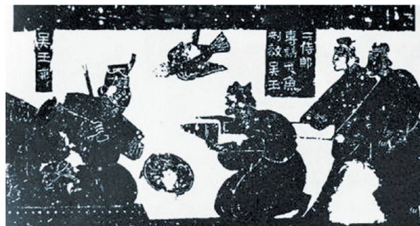
汉石像描绘的专诸刺像