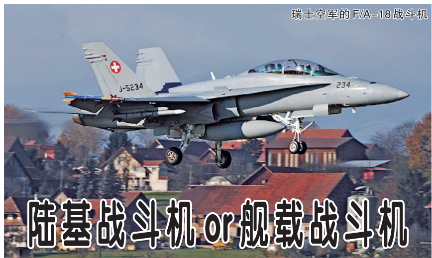
瑞士空军的F/A-18战斗机