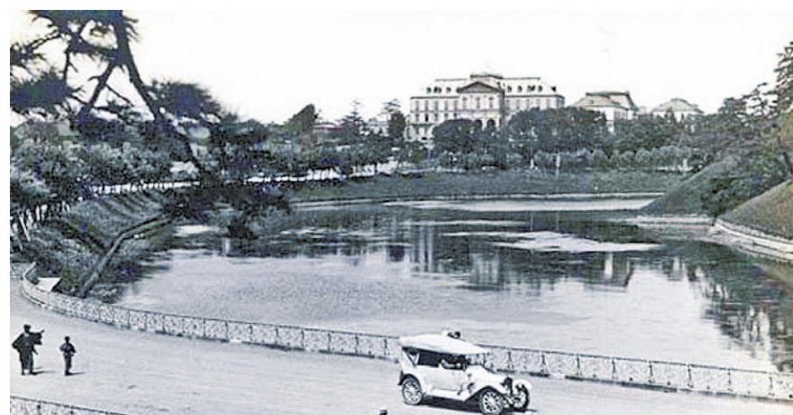
旧日本陆军参谋本部