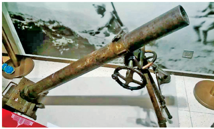
击毙阿部规秀的迫击炮如今陈列在中国人民革命军事博物馆

1939年11月7日，八路军在河北涞源黄土岭地区集中优势兵力，伏击前来“扫荡”的日军独立混成第2旅团，取得重大战果，毙伤日军900多人。