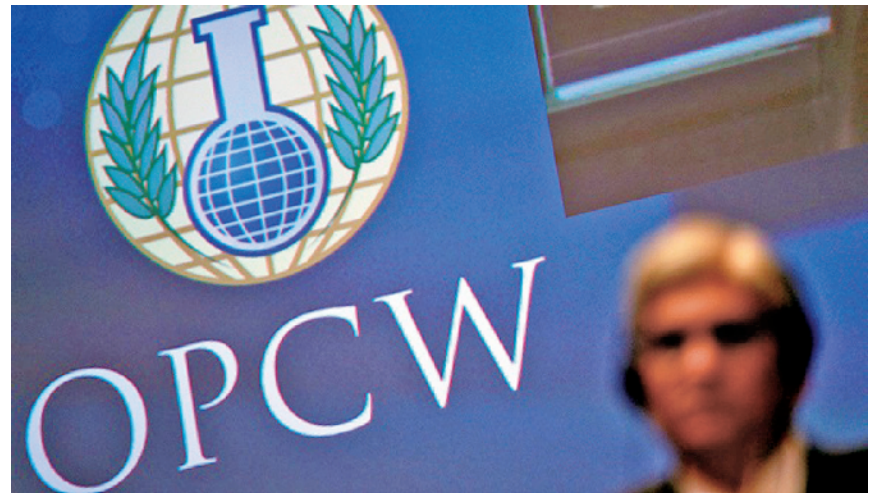
禁化武组织是根据1997年生效的《禁止化学武器公约》建立的国际组织。

据“中央社”报道，由日本民间企业开发制造的“MOMO2”号小型火箭，于当地时间30日清晨在北海道发射。但发射仅4秒后，火箭便坠毁。由于现场早已进行管制，因此无人受伤。“MOMO2”号全长10米、直径50厘米，大小跟电线杆差不多。加入燃料后的火箭，总重约1吨多。“MOMO2”号并未搭载任何人造卫星，但有搭载高知工业大学所开发的音波观测装置。