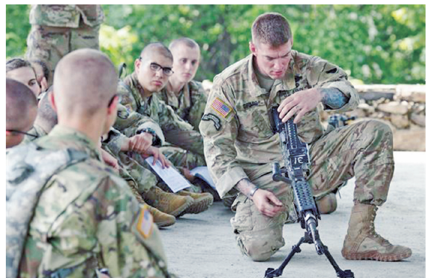
美军预备役军官教新兵如何使用M240B机枪。