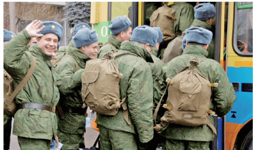
即将接受军事集训的俄罗斯预备役人员。

俄议会上院联邦委员会国防和安全委员会委员弗朗茨·克林采维奇说，征招预备役参加集训是计划内措施，在凡事均涉及国防安全的今天，这一举措意义重大。现在对预备役人员的训练工作持什么态度，直接关系到我们每个人的安全，一点都马虎不得。预备役人员参加集训的主要任务，旨在完善他们在国防领域方面的职业技能和知识储备，其中非常重要的一点是，他们要学习并研究新式武器装备，还要掌握作战武器的使用规则和条件。现在，俄军的武器装备更新换代速度越来越快，技术含量越来越高，再加上叙利亚战争的磨炼和淬火，部队的作战技巧、战法打法也在不断发生改变。如果预备役人员不对其进行针对性训练，等到真正踏上战场，就不会成为一名合格的军人。