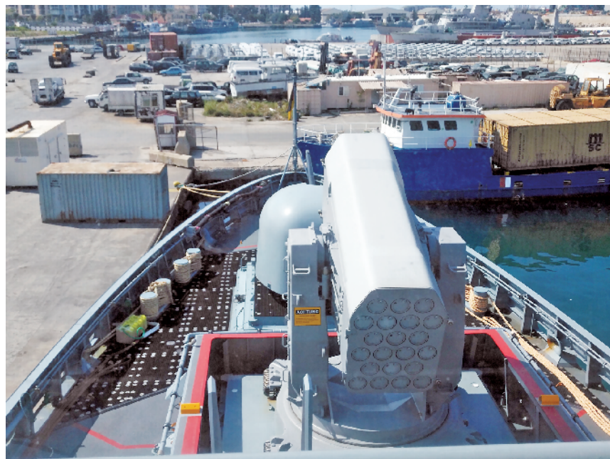
德国海军轻型护卫舰主炮周边铺设了黑色橡胶垫。