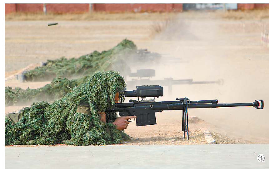
图①:斗鱼主播体验滑降训练,“666”弹幕刷屏。图②:特战队员进行房屋突入训练。图③:特战队员使用“大”字飞扑的方式跃下攀登楼。图④:特战队员开展狙击训练。