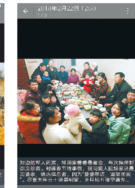
对边防军人而言，常回家看看是奢望，每次探亲都弥足珍贵。每逢春节，我向爱人回娘家还是回婆家，她选择后者，因为‘婆家年迈，渴望团圆……’。尽管大年三十婆家到家，正月初五提前返乡。