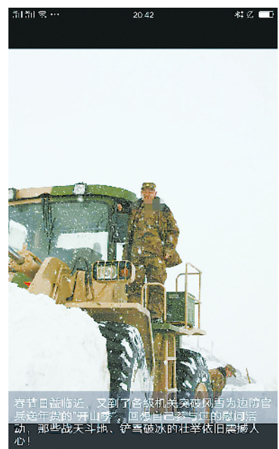
在村口苦战时，又到了各级机关突破风雪为边防官兵送年货的“开山季”，回想自己参与过的慰问活动，那些战斗地、铲雪破冰的壮举依旧震撼人心！

这算什么呀，他又在网上“炫”！孩子高了，我胖了……他都往朋友圈里晒，还说“军嫂军娃得胖点才能挡雨扛风”之类，也不怕人家笑话！但闺蜜却挺羡慕我，说他爱家顾家。这不假，他爱家，国家、父母家、自己的小家一个不少——每次好不容易探亲回来，单位有事他就急着往回奔；刚认识就跟我说是兄妹七个中唯一有固定收入的，婚后也少不了要贴补老家；对孩子和我更是舍得，这一次，从婆家回来他为了陪我在娘家也呆上两天，选择直飞回拉萨，却又心疼机票贵，在网上查了又查，发现从绵阳走要便宜3000块，就搭夜车跑到绵阳去飞……他就是这样的人，谁给他点好都记着，谁他都不想辜负，就是不怕累自己，还整天乐呵呵的。说实话，跟着他挺累的，但踏实不累心。