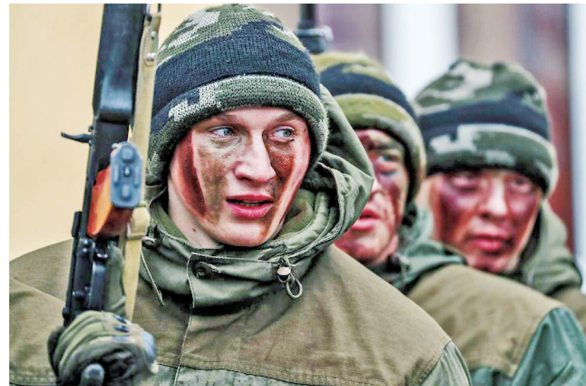
俄罗斯国民卫队士兵。

一遭艰苦卓绝的谈判过程；三是对伊朗来说，让其接受比伊核协议更严厉的条款，而没有更多的激励措施，可能性也不大，而美国如果加大施压力度，伊朗将采取报复性措施；四是虽然许多国家希望处理伊核协议期满后的问题，但现在时机远未成熟；五是欧洲、中国、印度、日本、韩国等石油买家希望继续从伊朗进口石油，更严厉的协议不符合各方的经济利益。在特朗普给出的120天“最后期限”内，国际社会很可能拿不出一个让美国满意的协议。按照特朗普全面清理“奥巴马遗产”及全面遏制伊朗的既定战略，美国退出协议的可能性不容忽视。由于除美国外其他缔约方都认可协议，伊核协议不会很快解体，但其前途将会蒙上一层阴影，同时意味着中、俄、欧将在伊核问题上与美国渐行渐远。(作者系中国现代国际关系研究院美国所副研究员)